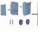
Roçadeira Frontal TA72-00010