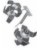
Roçadeira Central TA73-00010