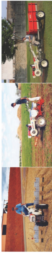
Rodador de café