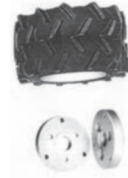
Pneu Duplo c/ Espessador TA15-00011