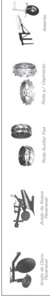
Arado de Disco Reversível